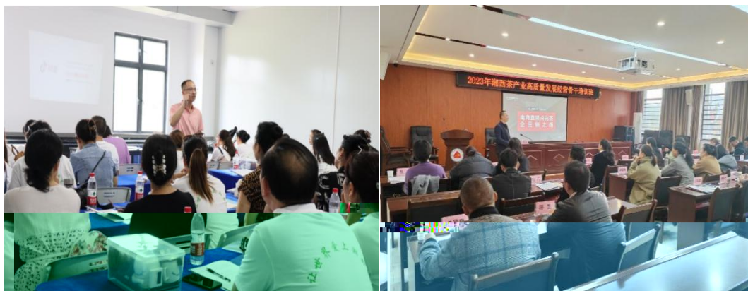
图 企业协助学校为湘西茶企开展电商直播培训

更 对 电 的 。 过 的 ， 茶 得 更 地 电 播的操 、 策 等方 的 ， 电 的 奠定 础。