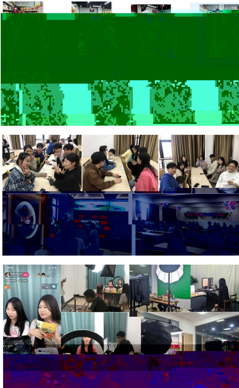
图 组织学生开展实习实训