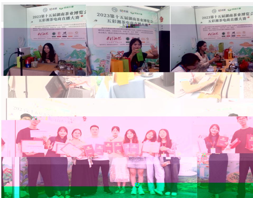
图 “湖南省第十五届茶博会” 电商直播比赛现场

播和方的，短 得的步。 队比10多单、单， 包但不、等多个，的 和队得的高度。的 得不对公的，更对参 付出和的充分定。